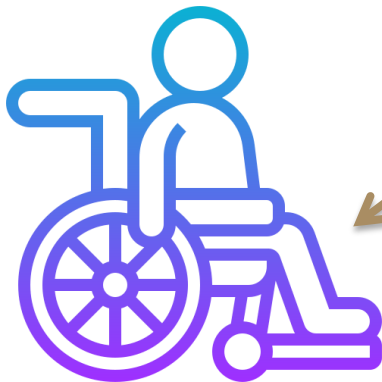
ກຸ່ມຄົນພິການ