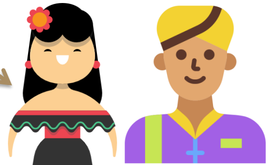
ກຸ່ມຄົນທຸກຊົນເຜົ່າ