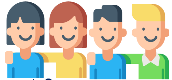
ກຸ່ມຄົນຫຼາກຫຼາຍທາງເພດ